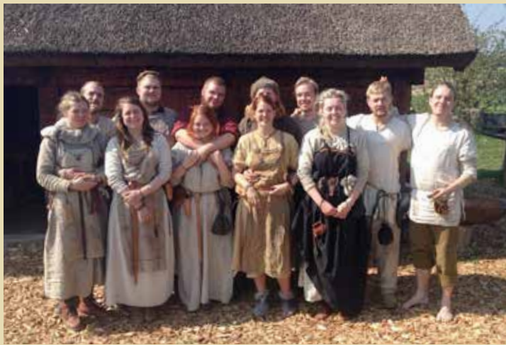
De unge arkæologer fra Moesgård